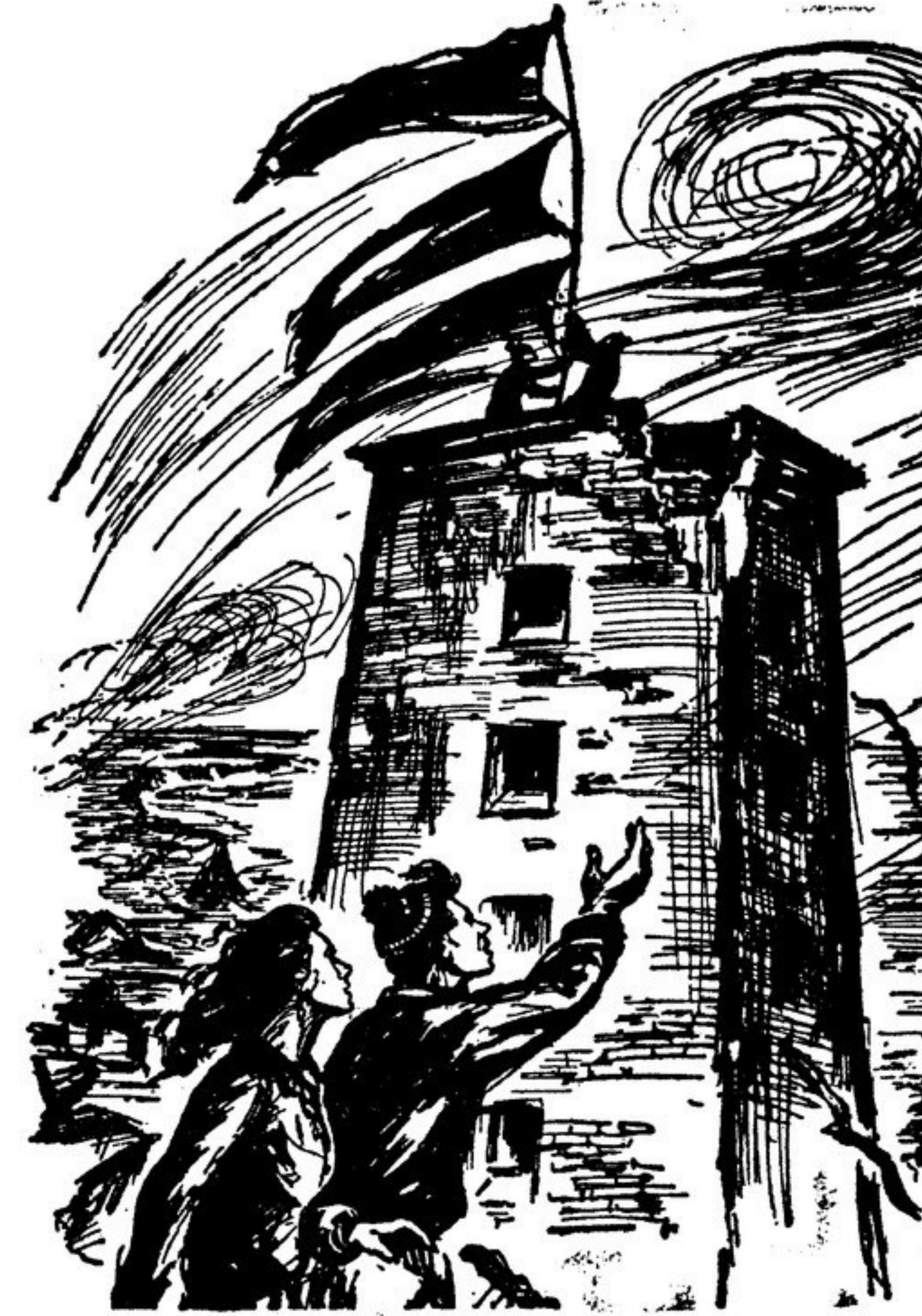
Рисунок из газеты «Юнге вельт» — Центрального органа Союза свободной немецкой молодежи.